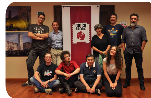
La Giuria del Gioco dell'Anno