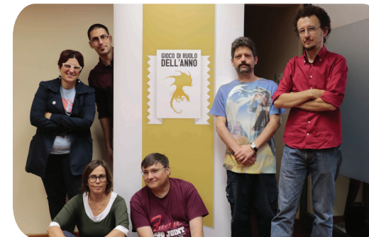
La Giuria del Gioco di Ruolo dell'Anno